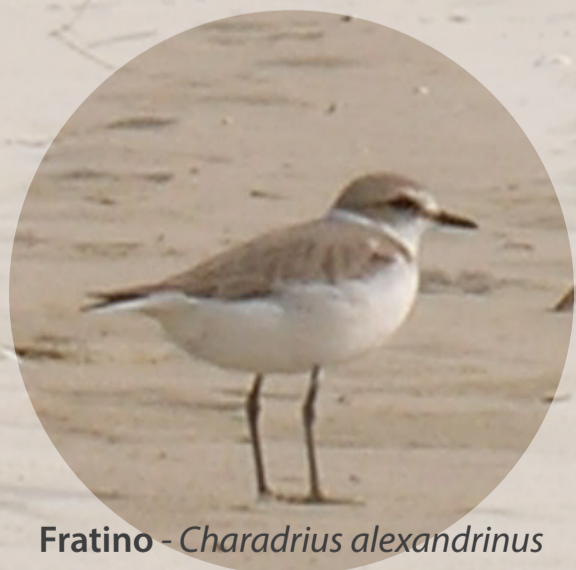
Fratino - Charadrius alexandrinus